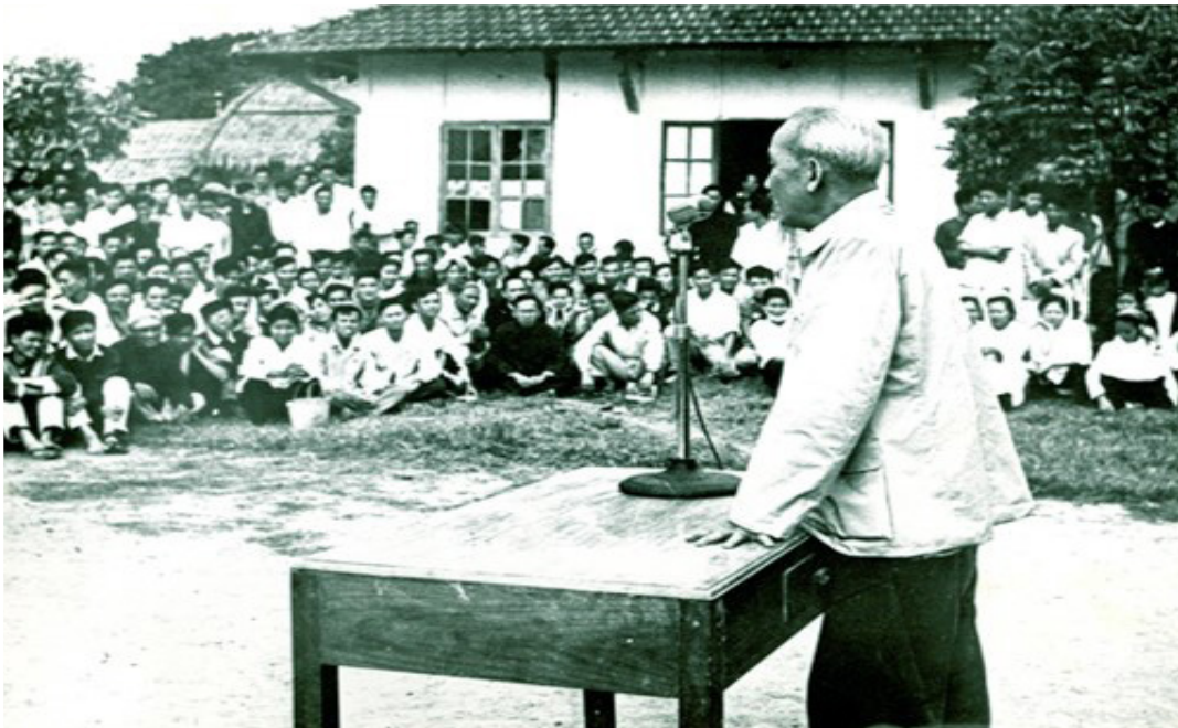
Chủ tịch Hồ Chí Minh nói chuyện với thầy, cô giáo và học sinh trường Trung học GTVT Thủy bộ.

Theo Hồ Chí Minh, “trồng người” trước hết phải làm cho người ta nắm vững được mục đích, ý nghĩa của việc mình làm. Muốn cho người ta nắm vững mục đích, ý nghĩa việc làm, nhất định phải có người làm công tác trồng người và người làm công tác đó phải có những hiểu biết sâu sắc về cách thức, con đường, biện pháp